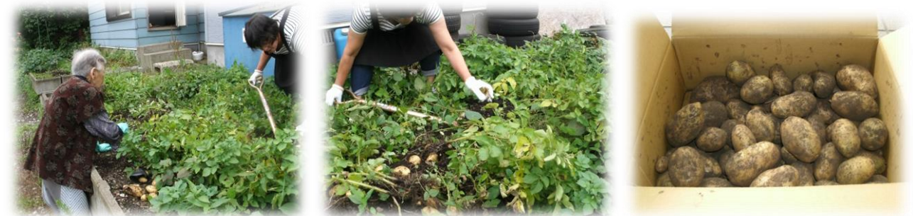
ひまわりの裏の畑でジャガイモ掘り