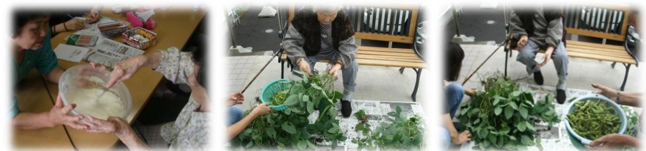
みんなでお昼ご飯の準備