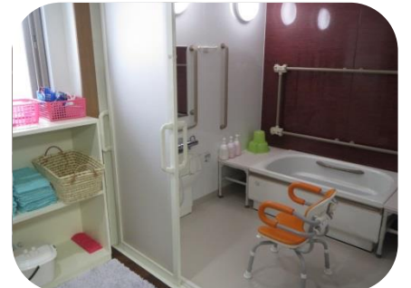
浴室 (個浴となっております)