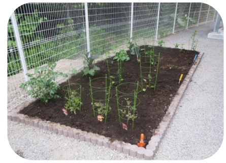
デイホームひまわり農園